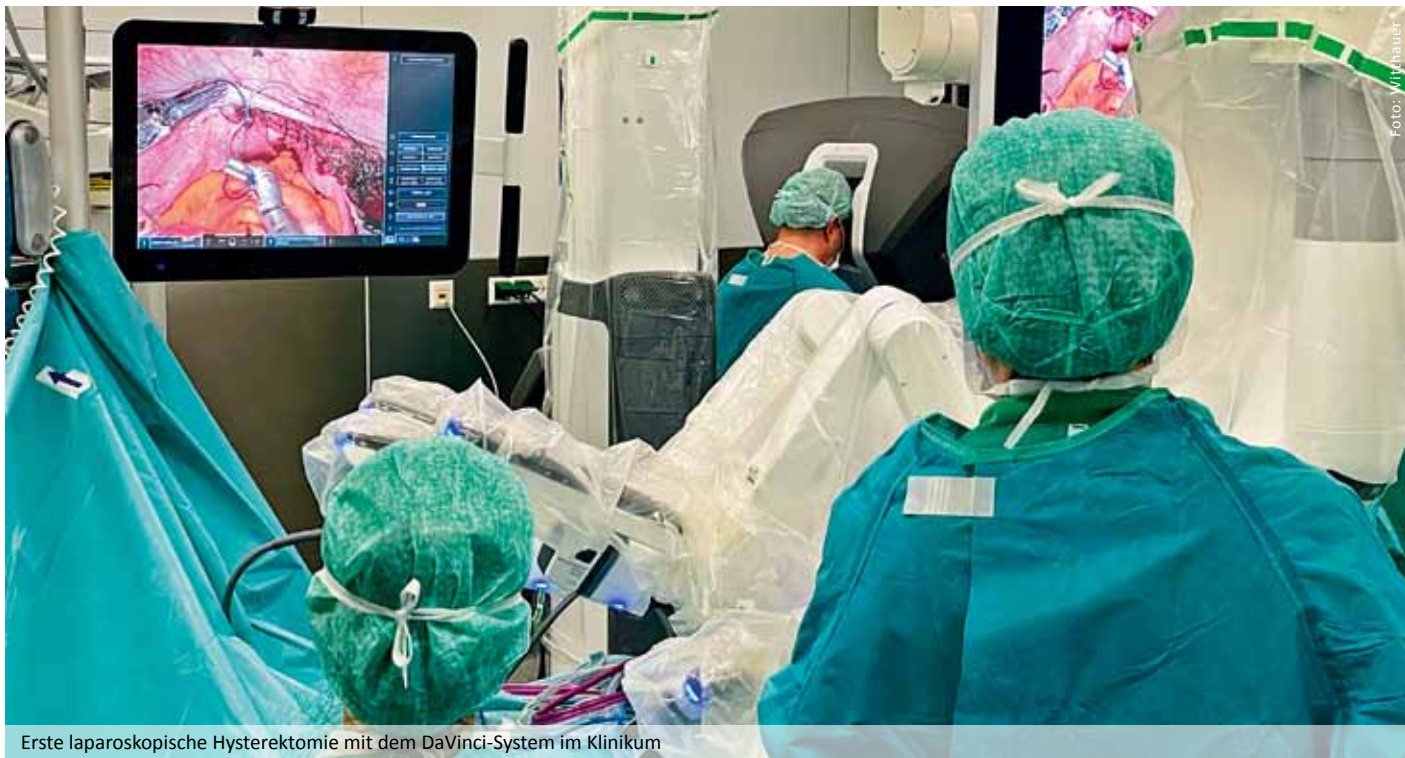
Erste laparoskopische Hysterektomie mit dem DaVinci-System im Klinikum